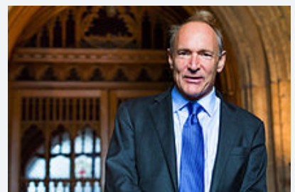
Sir Tim Berners-Lee von Paul Clarke - Eigenes Werk. Lizenziert unter CC-BY-SA 4.0 über Wikimedia Commons - https://commons.wikimedia.org/wiki/File:Sir_Tim_Berners-Lee.jpg#/media/File:Sir_Tim_Berners-Lee.jpg

Der britische Physiker und Informatiker Tim Berners-Lee stellte am 13. November 1990 das erste Hypertext-Dokument online. Er gilt somit auch als Begründer des World Wide Web. http://info.cern.ch