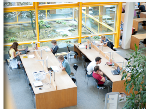
Im Lesesaal der Bibliotheks-Zentrale (2019)