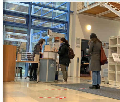
Check-in im Foyer der Bibliotheks-Zentrale