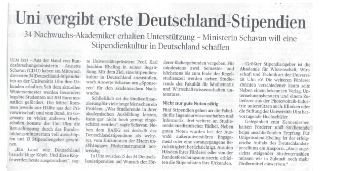
Die ersten 34 Deutschlandstipendiaten der Uni Ulm.